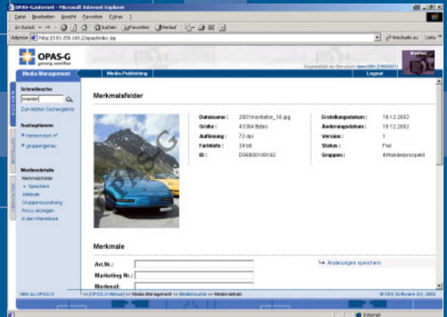
Das mit OPAS-G.watermark eingepflegte Wasserzeichen verhindert die unbefugte Nutzung von heruntergeladenen Bildern.